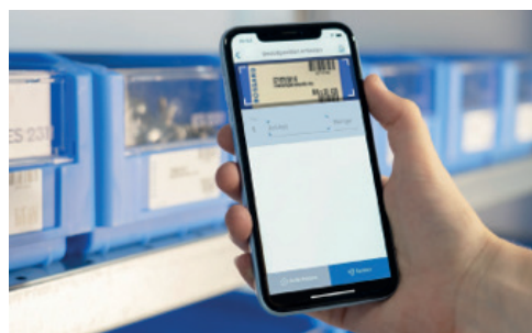
Elektronische KANBAN über Smartphone App (z.B. Bosshart, SFS).