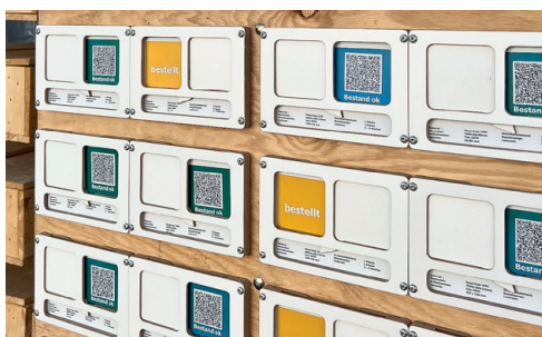
QR-Ampel Wegmüller AG.