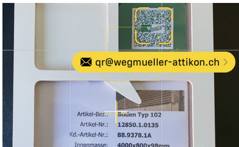
Einfache Bestellung mit dem Smartphone über den vordefinierten QR-Code.