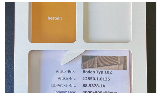
Nach der Bestellübermittlung die QR-Ampel auf «bestellt» setzen.