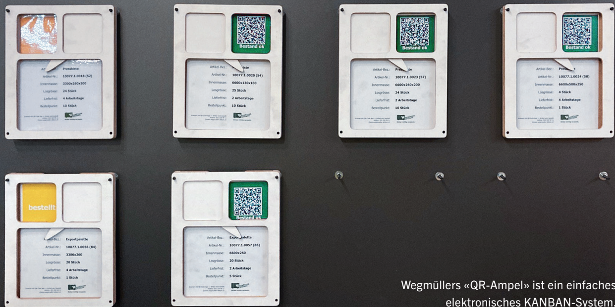
Wegmüllers «QR-Ampel» ist ein einfaches elektronisches KANBAN-System.