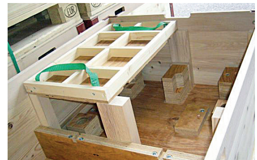
Innenausbau für Montagematerial.