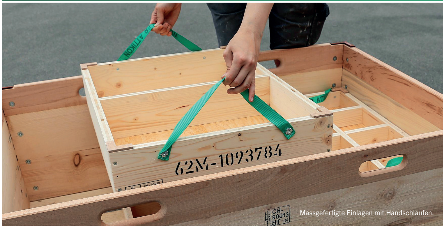
Massgefertigte Einlagen mit Handschlaufen.