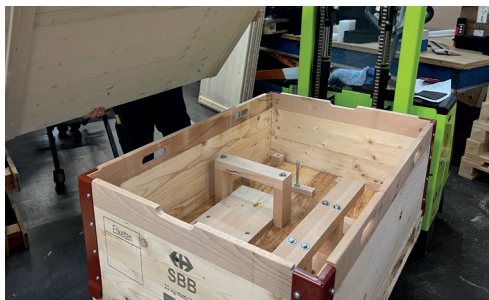
Verschraubbare Befestigung für Spezialwerkzeug.