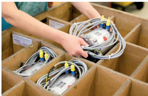
Kartonfächer für Elektromotoren.