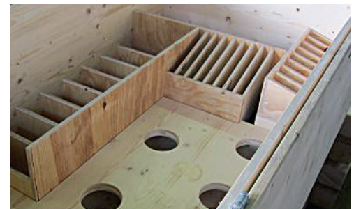
Innenausbau für Messezubehör.