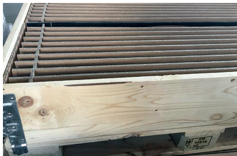
Fächer aus Wellkarton für Blechteile.