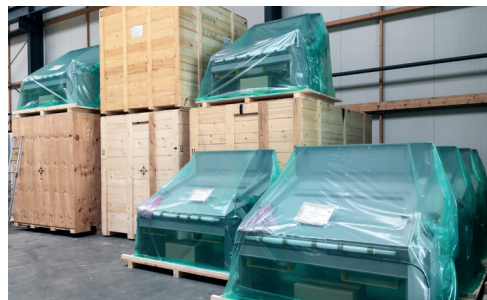
Maschinen für Containerversand in VCI-Folie gehüllt.