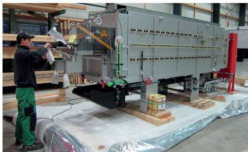
Trockenmittelbeutel saugen die Restfeuchtigkeit auf.