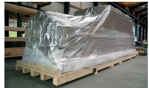
In Aluminium-Verbundfolie eingeschweisste Maschine.