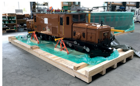
Ein Grossmodell auf Holzboden bereit zum Einpacken in die VCI-Folie.