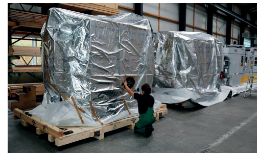
Beschriftung der Alu-Verbundfolie.