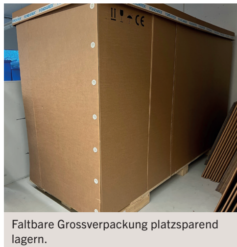
Faltbare Grossverpackung platzsparend lagern.