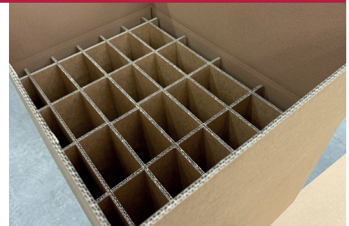
Komplett recyclingfähige Innenverpackung.