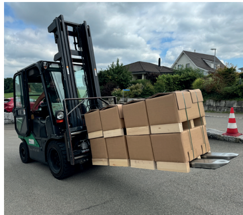
Schwere Gussteile in recyclingfähigem Karton anstelle einer Holzverpackung.