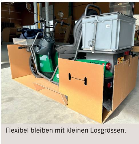
Flexibel bleiben mit kleinen Losgrößen.