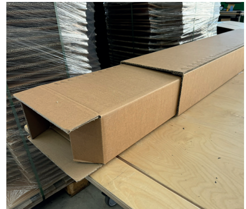
Teleskopverpackung für verschiedene Längen.