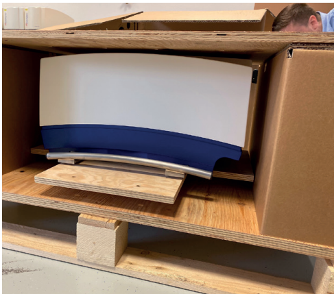
Erschütterungsarme Verpackung für vier Geräte.