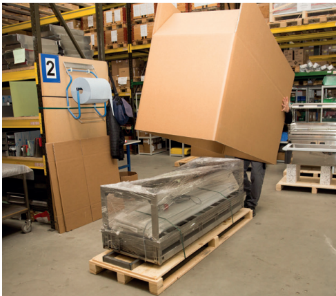
Bis 2000 kg schnell und ergonomisch verpackt.

Willst auch Du effizient, individuell und nachhaltig verpacken?