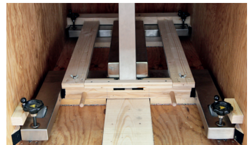
Geräte auf Rollen mit ergonomischen Einlagen fixiert.