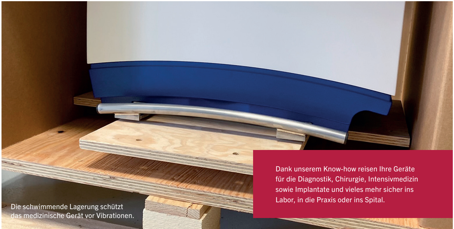
Die schwimmende Lagerung schützt das medizinische Gerät vor Vibrationen.

Dank unserem Know-how reisen Ihre Geräte für die Diagnostik, Chirurgie, Intensivmedizin sowie Implantate und vieles mehr sicher ins Labor, in die Praxis oder ins Spital.