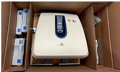
Kartonkiste mit zwei kleinen Zubehör-Boxen.

Dank unserem Know-how reisen Ihre Geräte für die Diagnostik, Chirurgie, Intensivmedizin sowie Implantate und vieles mehr sicher ins Labor, in die Praxis oder ins Spital.