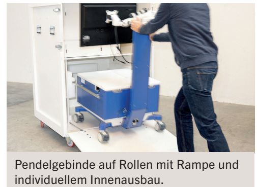
Pendelgebinde auf Rollen mit Rampe und individuellem Innenausbau.