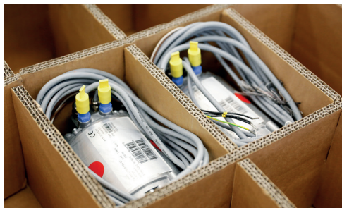
Passgenaue Einlagen für Halbfabrikate.