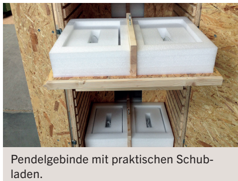
Pendelgebinde mit praktischen Schubladen.