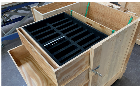
Schublade mit Einlage für Gussteile aus geschlossenzelligem Schaumstoff.