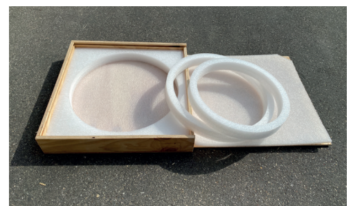
Holzkiste mit variabler Schaumstoffeinlage.