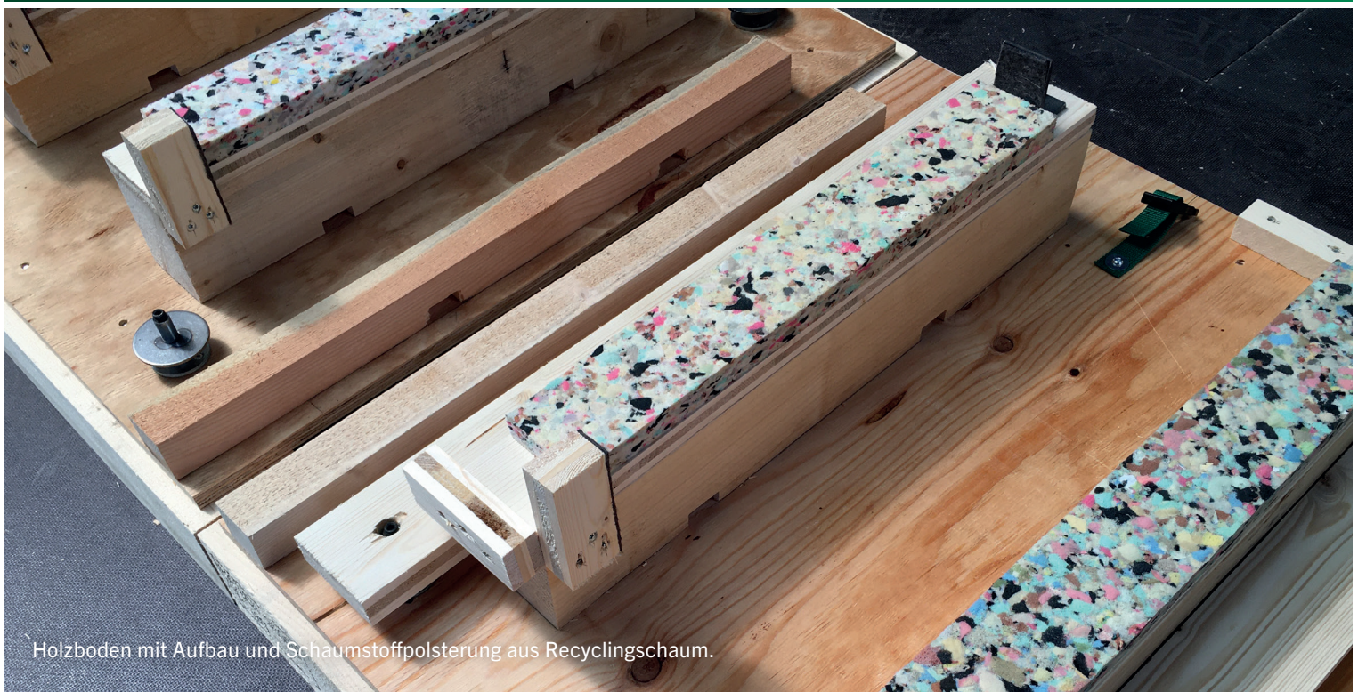
Holzboden mit Aufbau und Schaumstoffpolsterung aus Recyclingschaum.