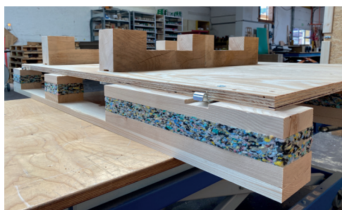
Sandwichboden aus Recyclingschaum federt Erschütterungen ab.