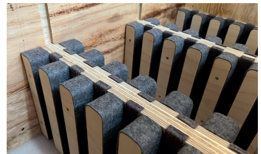
Holzeinlage für lackierte Blechteile mit Filz gepolstert.